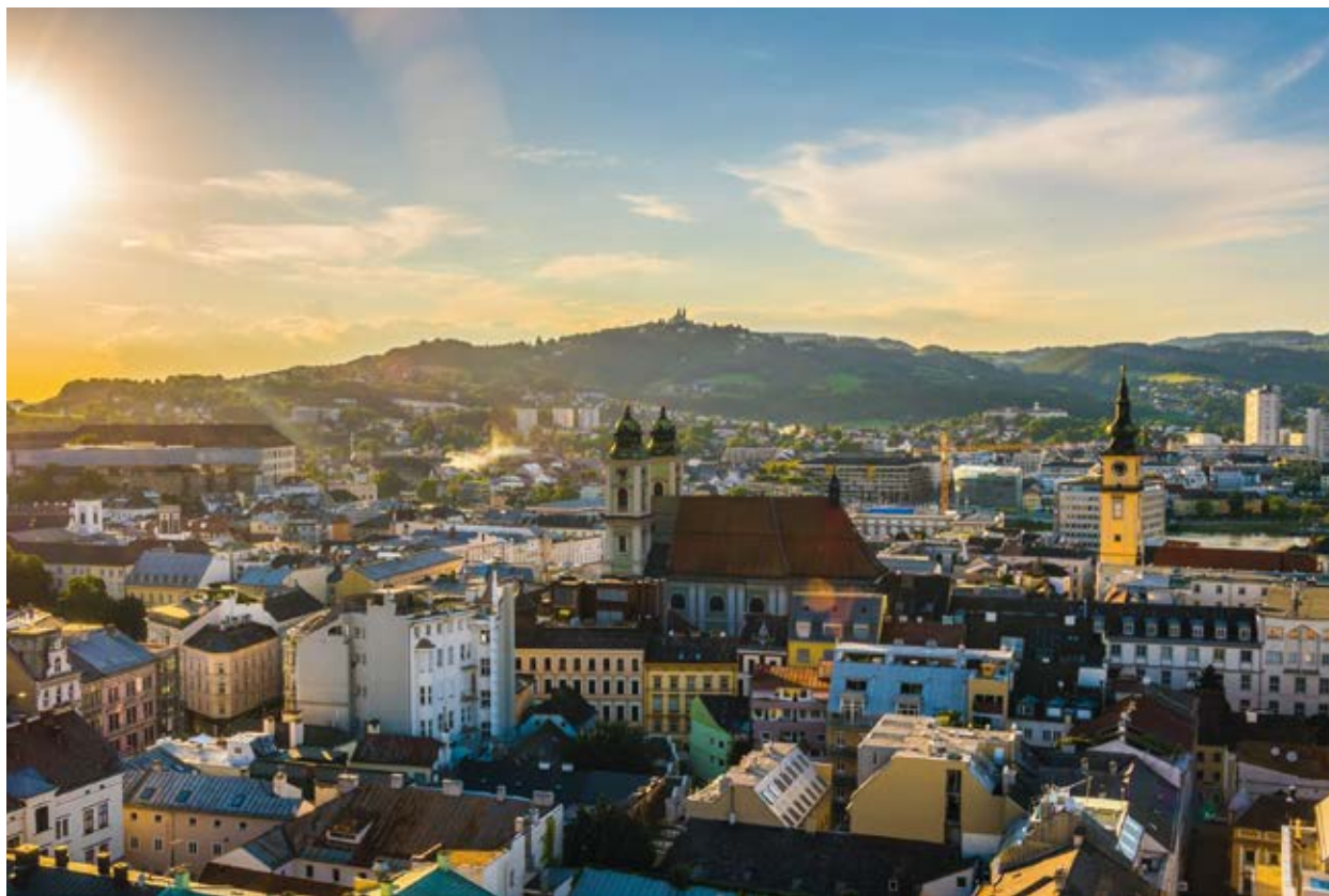
LINZ Die Stadt, die Veränderung lebt und Unbekanntes an vertrauten Orten entdecken lässt.

W er kennt Sie nicht, die Plätze, in die man sich auf den ersten Blick verliebt. Ein malerischer Ort mit versteckten Wasserfällen. Oder war es der Zwischenstopp am Aussichtspunkt mit dem idyllischen Fernblick auf die hügelige Landschaft? Vielleicht aber auch das Panorama vom Linzer Schlossmuseum über die Dächer der Stadt? Oberösterreich bietet viele Plätze und Orte, die sich zum Verlieben eignen. Unterteilt in vier Viertel, die unterschiedlicher nicht sein könnten, bilden die Menschen hier eine bunt gemischte Einheit aus Dialekten, Traditionen und Lebensräumen. Die traditionelle Vierteilung - Hausruckviertel, Innviertel, Mühlviertel und Traunviertel - entspricht der Kreiseinteilung der Habsburgermonarchie Mitte des 18. bis Mitte des 19. Jahrhunderts. Heutzutage hat diese Vierteilung keinerlei politische Bedeutung mehr, aber die feinen Unterschiede bleiben bestehen.